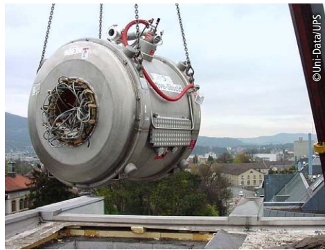
Bild-PR für Uni-Data: Hier die Einbringung eines neuen Magneten für einen Computertomographen über das Dach.

etablierte Agentur erstmals Geld auf mein Konto überwiesen hat. Und dafür habe ich im Gegenzug die ganze Branche tief inhaliert: Texte geschrieben, die Journalisten recherchiert und Konzepte für das Marketing erdacht. Nun sind diese Anfänge bald 20 Jahre her, aber mit einer derartigen Gründungsgeschichte im Nacken, ist es doch nur verständlich, dass wir von der Logistik-Branche nicht lassen können.“