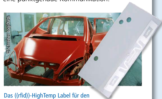
Das ((rfid))-HighTemp Label für den Einsatz in Hochtemperatur-Produktionsprozessen wie der Automobilproduktion.

Starke Marken, erfolgreiche Mittelständler und innovative Start-ups waren schon Kunde von vibrio: Der auf IT und Medizintechnik spezialisierte deutsche Logistiker Uni-Data, ein Tochterunternehmen der UPS Logistics Group, das später als UPS Supply Chain Solutions firmierte; das Geschäftsfeld Logistics Automation von KRATZER mit seiner Logistik-Lösung cadisTRANSPORT für die Abwicklung der operativen Arbeitsprozesse bei der Frachtgutverteilung sowie Truck24, ein Anbieter von Telematik für Logistik, Transport und Service-management. Das Spektrum der Logistik-Themen war breit und ist es immer noch. Aber für uns gilt die Devise: Je komplizierter und technischer, umso mehr ein Fall für vibrio – und eine punktgenaue Kommunikation.